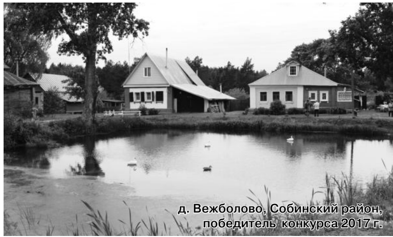
д. Вежболово, Собинский район, победитель конкурса 2017 г.

В селе Борисовское Суздальского района 6 июня прошло праздничное мероприятие по случаю начала конкурса на звание «Самой красивой деревни».