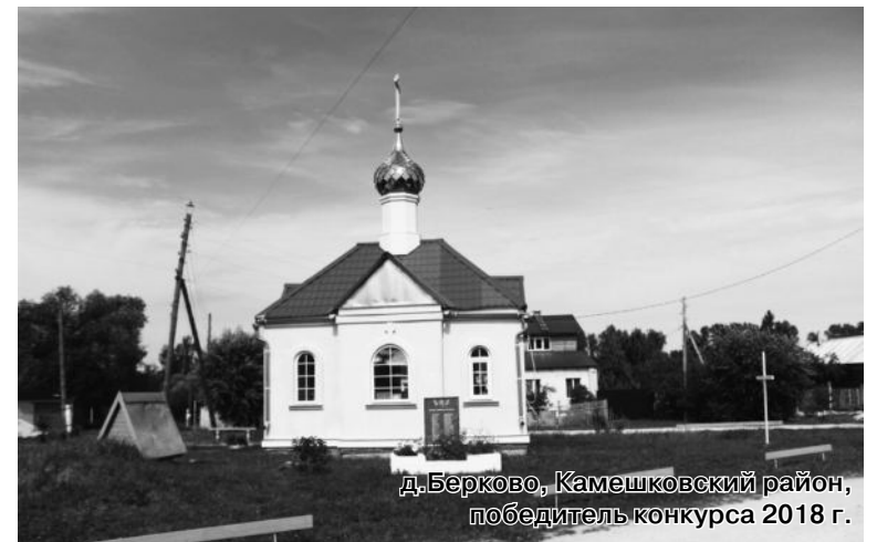
д. Берково, Камешковский район, победитель конкурса 2018 г.

На призовые деньги селяне установили 25 детских и спортивных площадок, более 15 памятников землякам, погибшим в годы Великой Отечественной войны, отремонтировали десятки колодцев и уличных дорог, модернизировали уличное освещение и сделали многое другое.